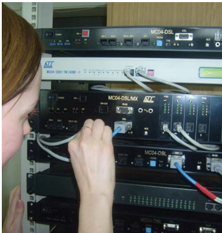
Подготовка каналобразующего оборудования для оказания универсальных услуг связи